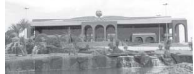
PALÁCIO ARAGUAIA - Praça dos Girassóis